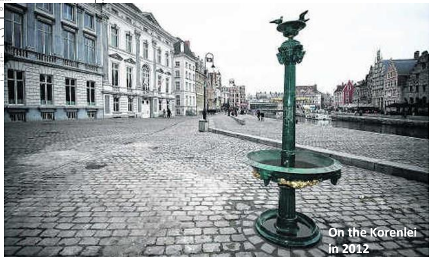
On the Korenlei in 2012

These pictures were taken in 2012 and 2019, i.e. 16 and 23 years after application of the ZINGA system.