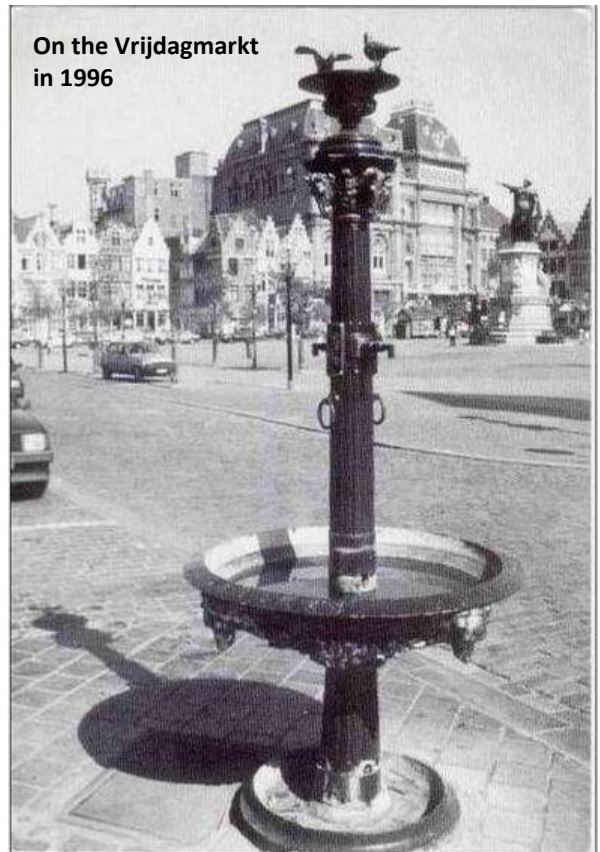
On the Vrijdagmarkt in 1996