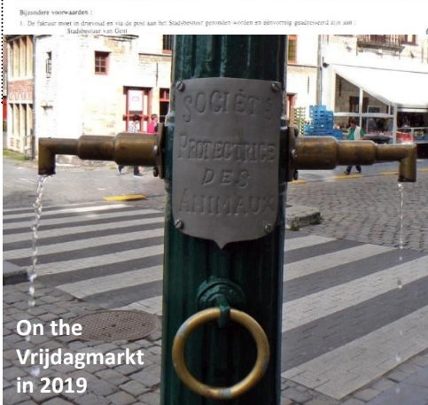
On the Vrijdagmarkt in 2019