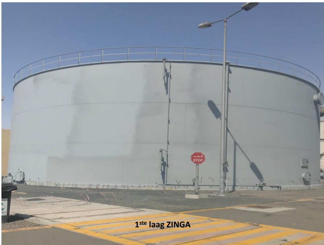
1 ste laag ZINGA